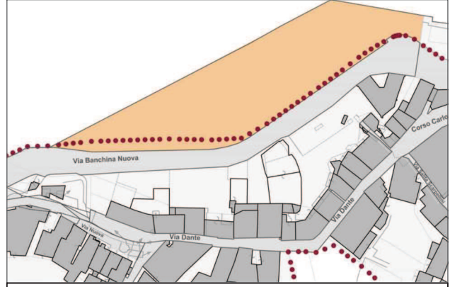
Estratto tavola Ambiti progettuali